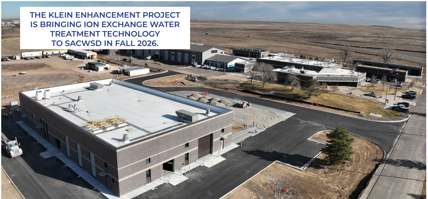
THE KLEIN ENHANCEMENT PROJECT IS BRINGING ION EXCHANGE WATER TREATMENT TECHNOLOGY TO SACWSD IN FALL 2026.

For more information about the District's response to PFAS, please visit the District website at southadamswaterco.gov/PFAS .