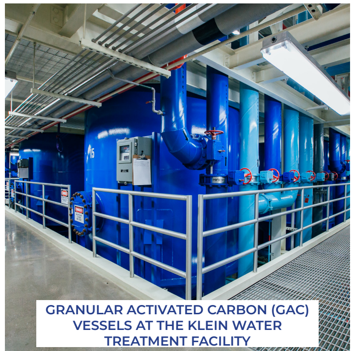
GRANULAR ACTIVATED CARBON (GAC) VESSELS AT THE KLEIN WATER TREATMENT FACILITY

A copy of Denver Water's 2026 Water Quality Report is provided following the District report or may be viewed at: https://www.denverwater.org/your-water/water-quality/water-quality-reports .