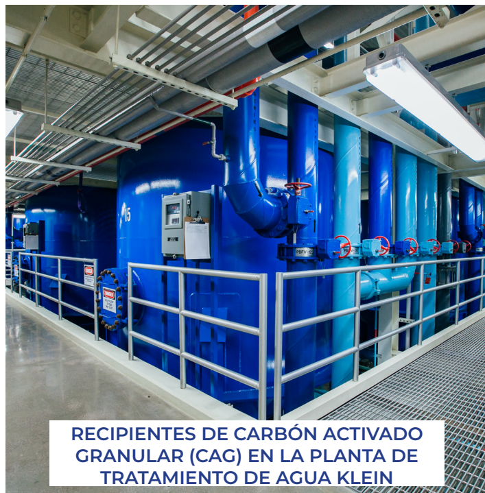
RECIPIENTES DE CARBÓN ACTIVADO GRANULAR (CAG) EN LA PLANTA DE TRATAMIENTO DE AGUA KLEIN

Una copia del Informe de Calidad del Agua 2026 de Denver Water se proporciona a continuación del informe del Distrito o puede consultarse en: https://www.denverwater.org/your-water/water-quality/water-quality-reports .